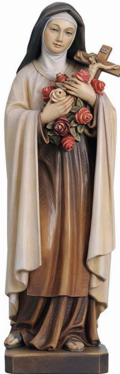
③ Hl. Thérèse v. Lisieux

Patronin der Fischer, Schiffer und Müller, der Armen, Not- leidenden, Patronin der Pfarrhaushälterinnen